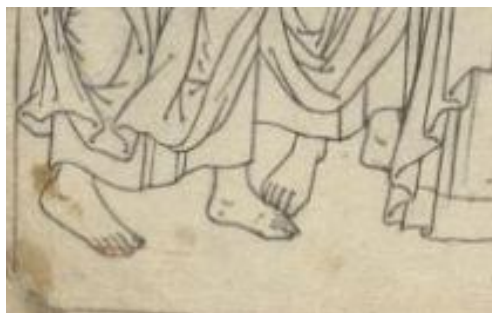
Фрагмент иконного образца конца XIX в. Номер в ГК: 22496931