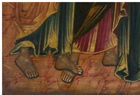
Фрагмент анализируемой иконы из Лувра

Возможную вариативность фиксируют и иконные образцы — так, на одних Петр отчетливо наступает на ногу Иоанну (номера в ГК: 30425487, 30476979), а на других (номера в ГК: 22808306, 27701335, 22497003) этот жест не воспроизводится. Вероятно, некоторые иконописцы понимали странность попирания ступни и старались избежать этой детали, при этом максимально сближая ступни апостолов, — на отдельных прописях они будто упираются друг в друга (номера в ГК: 15462255, 15462273, 15462258, 22496931).