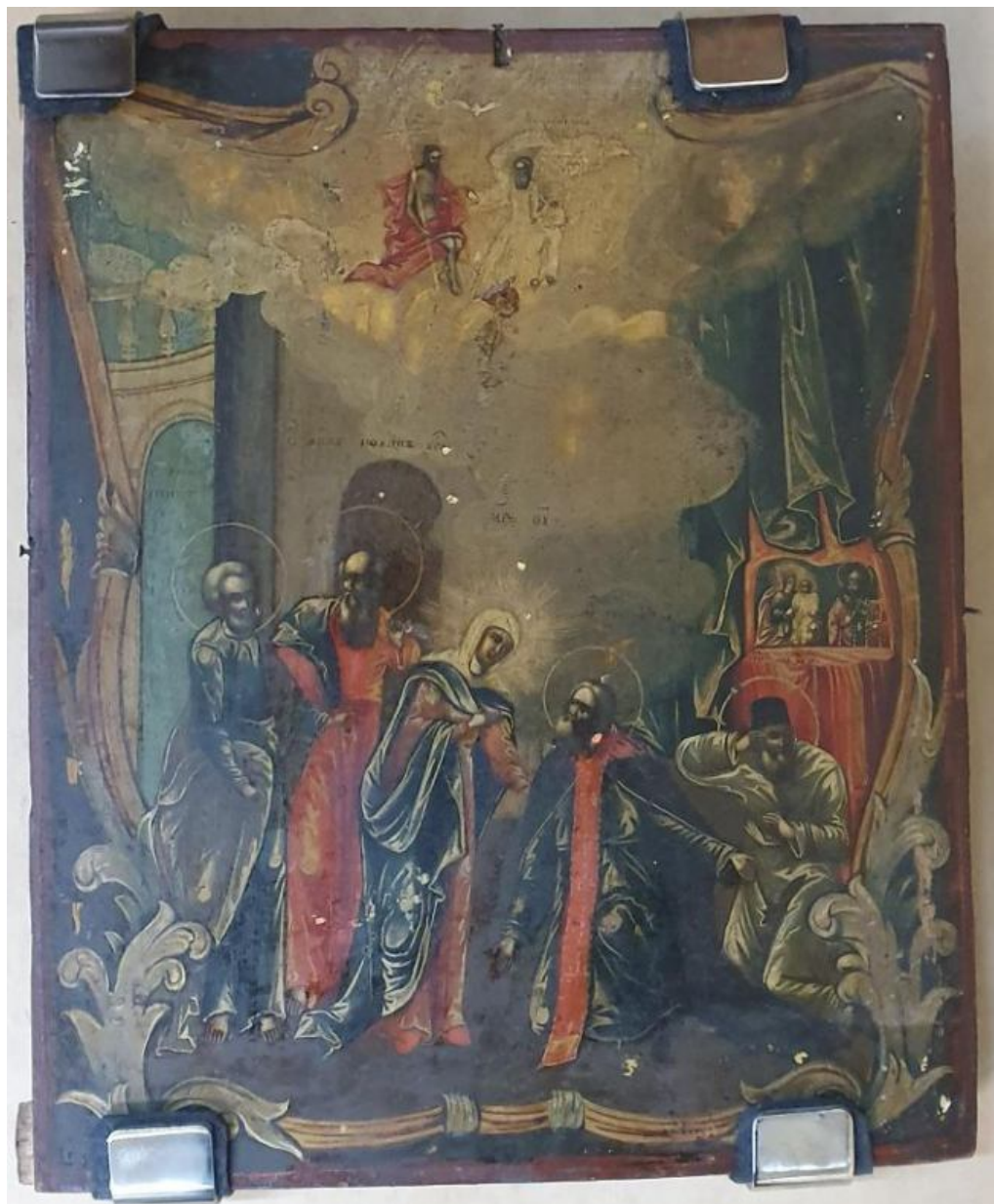
Буквальная иллюстрация жития: прикосновение Богоматери к Сергию Радонежскому. Икона XVIII в., номер в ГК: 22004651

Апостолы: попираие ноги. Присутствие на иконе Петра и Иоанна соответствует житию Преподобного. При этом неясно, почему именно эти апостолы сопровождают Богоматерь при ее явлении. Прежде всего, надо учитывать, что это два избранных ученика Христа, имеющие «первостепенное и притом именно иерархическое значение [среди апостолов]» [Булгаков, 1926: 5]. Также стоит обратить внимание на один евангельский сюжет с участием обоих: «Настал же день опресноков, в который надлежало заколоть пасхального агнца, и послал