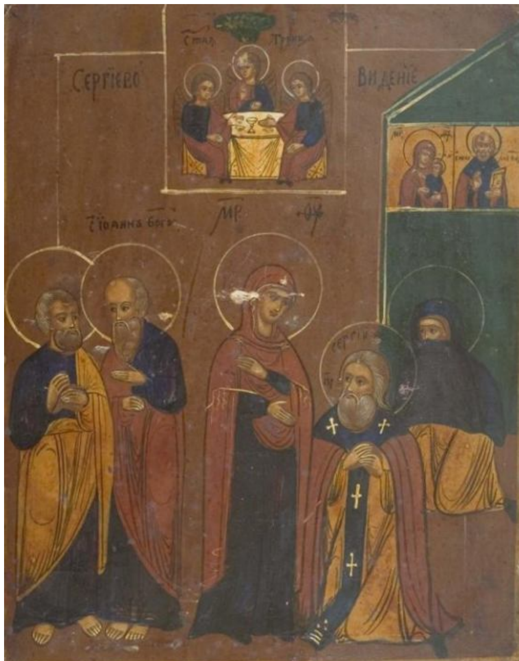
Ладонь Приснодевы опущена по направлению к коленопреклоненному Сергию. Икона XIX в. Номер в ГК: 25944914

Положение рук на анализируемом образце из Лувра исключает возможность непосредственного контакта — левая рука Богоматери значительно ниже рук Преподобного. Такую же (словно поднимающую — с ладонью вверх) жестикуляцию Приснодевы можно увидеть на некоторых иконах «Явления...» с коленопреклонным Сергием (см., например, номера в ГК: 25944914, 26503875, 25444162).