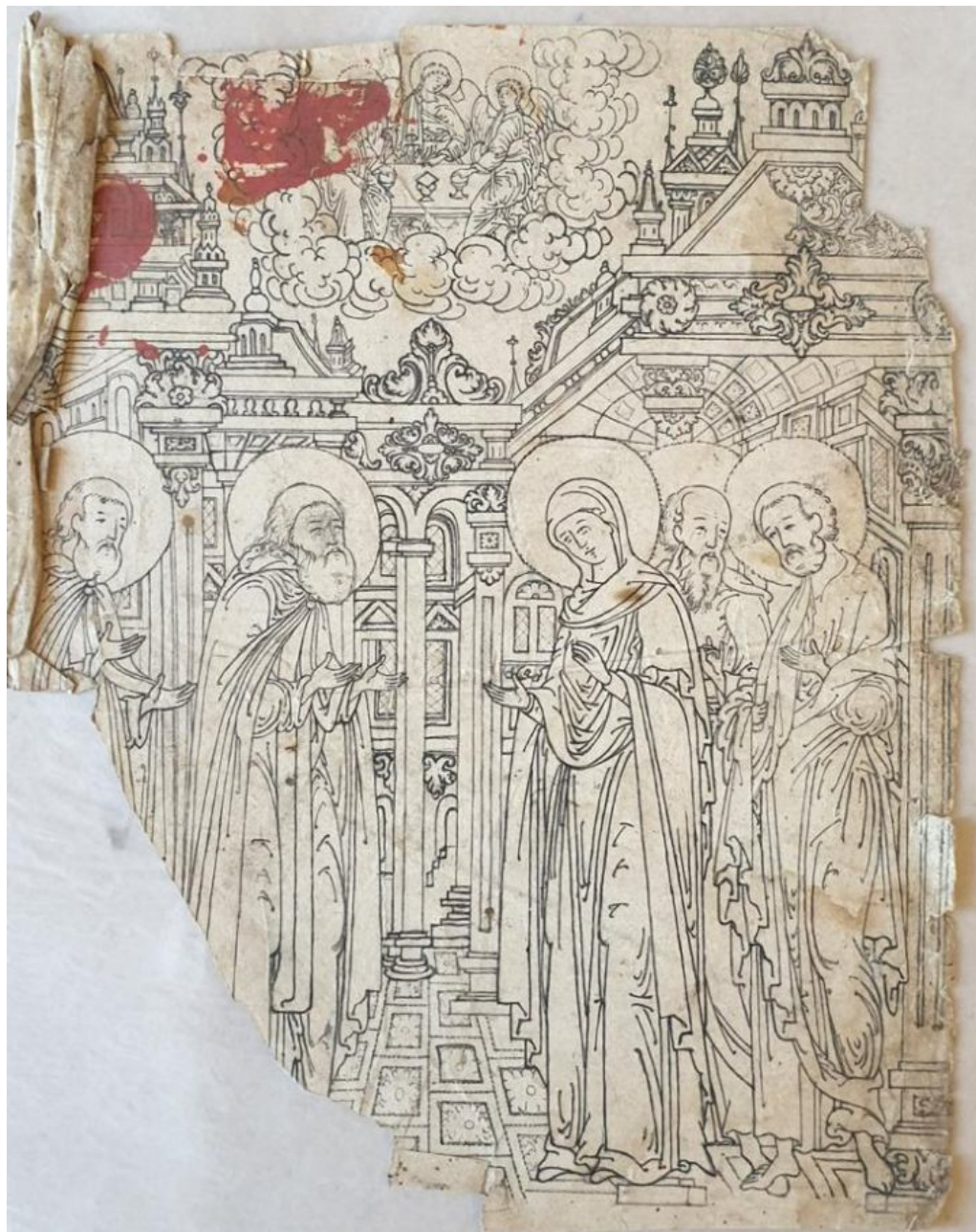
Детализация интерьера на иконном образце конца XVII — начала XVIII в. Номер ГК 30476979

«Фон (палатное письмо) трансформировался весьма динамично — от простых прямоугольных башен с двускатными кровлями [до] в академическом стиле написанных интерьеров. <...> Икона начала XVIII в. из ТСЛ (СПГИАХМЗ), где встреча Царицы Небесной с апостолами происходит на фоне роскошных палат с пышными занавесами и полом "в шахмат", является первым и типичным образцом барочной живописи» [Воронцова].