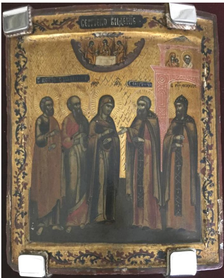
Редкий пример, когда преподобный Сергий прикасается к Богородице, их кисти находятся на одном уровне. Икона XIX в. Номер в ГК: 29409842

Положение рук Сергия Радонежского типично для иконографии «Явления...», чего не скажешь о руках Богородицы. На всех иконах (со стоящим изводом) из собрания ГИМ кисти Богородицы и Сергия Радонежского находятся на одном уровне (см., например, номера в ГК: 5353777, 22007736, 22004451, 29409842, 10489747, 5353290, 21252020, 27566039, 21869523) — кажется, вот-вот они соприкоснутся. Более того, на одной из икон XIX века Сергий Радонежский дотрагивается до локтя Богородицы (номер в ГК: 29409842).