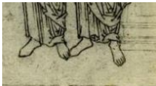
Ступни упираются друг в друга. Фрагмент иконного образца конца XVIII — начала XIX в. Номер в ГК: 15462258