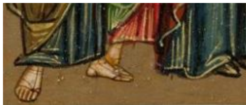
Фрагмент иконы 1912 г. Номер в ГК: 5352915