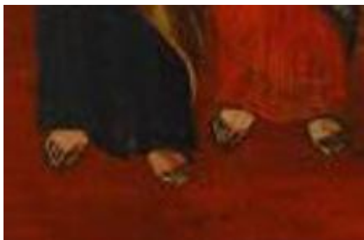
Ступни находятся на расстоянии друг от друга. Фрагмен иконы XIX в. Номер в ГК: 13175871

Надо отметить, что попираание ступней можно увидеть и на других иконах. Так, исследователь Л. О. Свиридова отмечает: «Апостол Павел апостолу Петру [наступает на ногу] на иконе Сошествие Святого Духа на апостолов, царь Соломон царю Давиду на иконе Сошествие во ад, что символизирует некоторое превосходство одного над другим в духовном плане» [Свиридова]. Однако в случае апостолов Петра и Иоанна утверждение о превосходстве неуместно. Выдвинем предположения, способные объяснить символику попираания ноги: