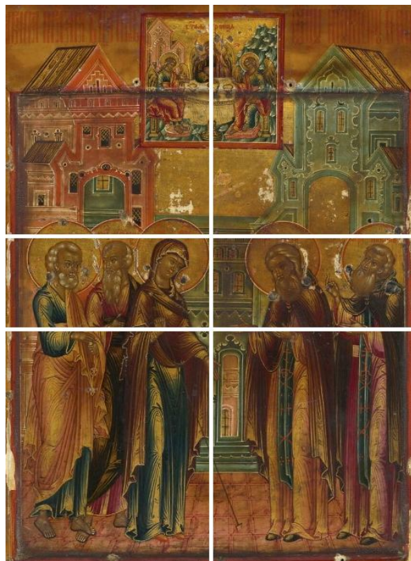
Разлиновка анализируемой иконы из Лувра

Также на центральной оси сверху находится клеймо с изображением ветхозаветной Троицы (иконография близка к известному образу Андрея Рублева) — это обязательный элемент «Явления...», важный в том числе для обозначения места действия (Троицкий монастырь).