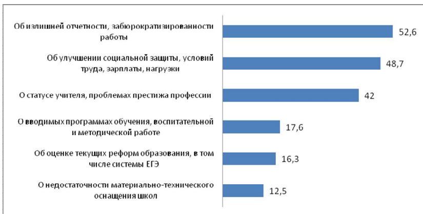
Рис. 1. Содержание письма Министру образования и науки РФ, % вопрос множественный (N = 200)

Достаточно интересные результаты были получены на вопрос «Если бы Вы могли написать письмо министру образования, которое он обязательно прочел бы, то о чем было бы это письмо?». Значительная часть «писем» посвящены «улучшению социальной защиты»: повышению заработной платы, снижению трудовой нагрузки, улучшению условий труда. Независимо от типа учреждения, учителей волнует вопрос «об излишней отчетности, забюрократизированности работы» и «о статусе учителя, проблемах престижа профессии» (рис. 1).